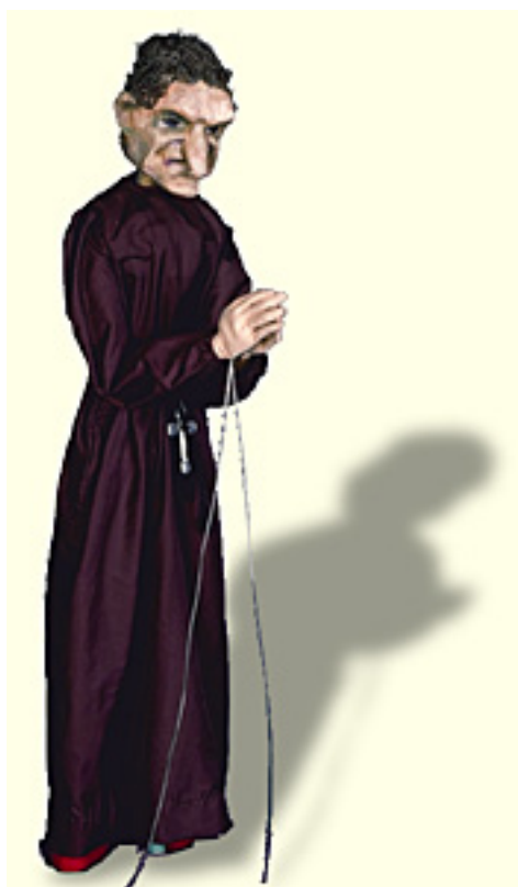
marionette à tige