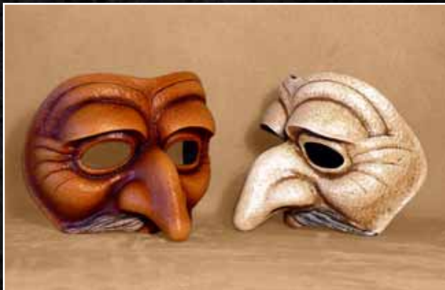
Pantalon Moustache 70$ Pantalon Moustache