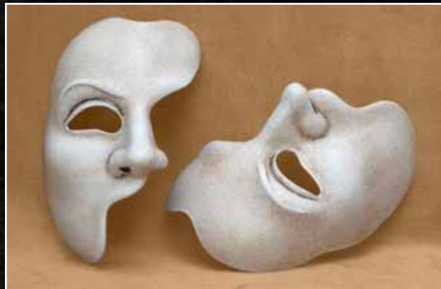
Opéra Opera 60$