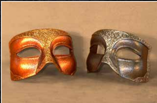
Loup Vénitien Grand 58$ Eye Mask Venitian Large