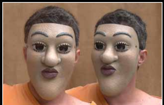
Madame 135$ Madam