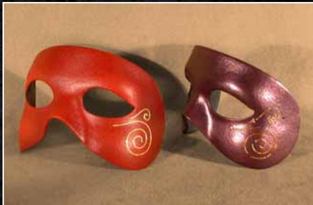
Loup Neutre Eye Mask Neutral 55$