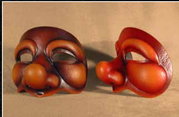
Gentil Naïf Gentle Fool