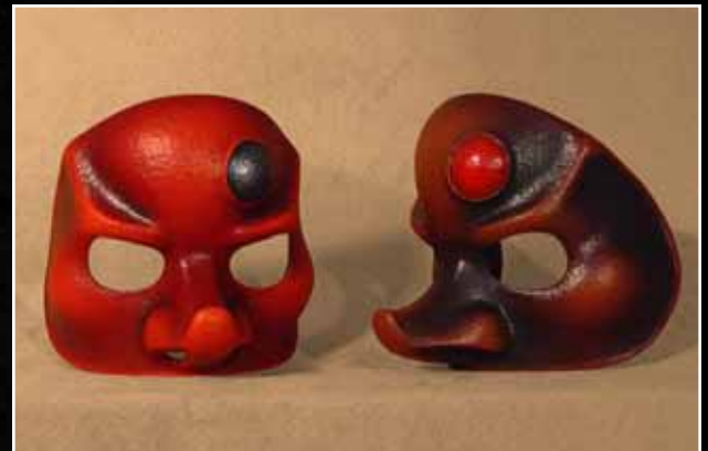
Arlequin Moderne 70$ Harlequin Modern