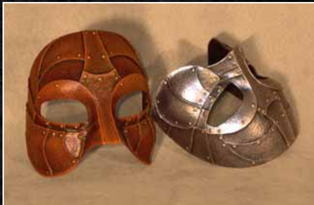
Gladiateur Gladiator 65$