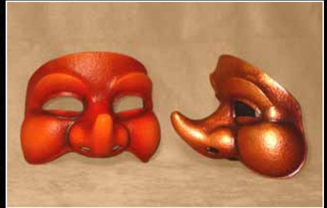
Loupiot Little Clown