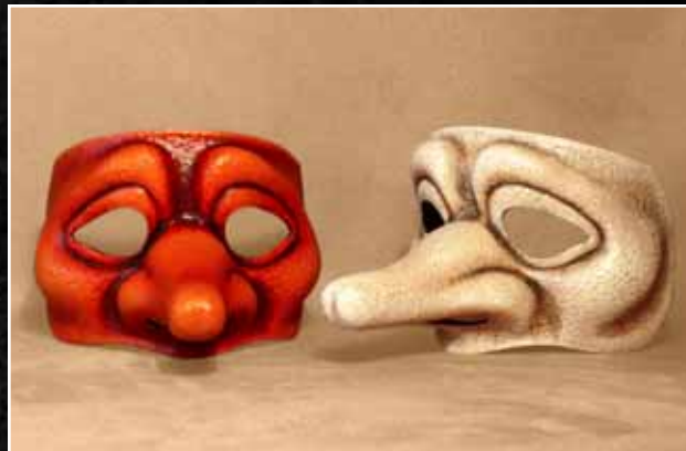
Zanni Ingénu 80$ Zanni Ingenuous