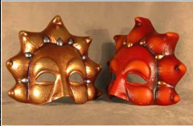
Soleil Sun 115$