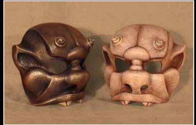
Chimère Chimera 90$