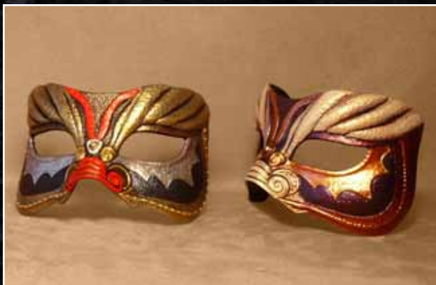
Loup Dragon Eye Mask Dragon 60$