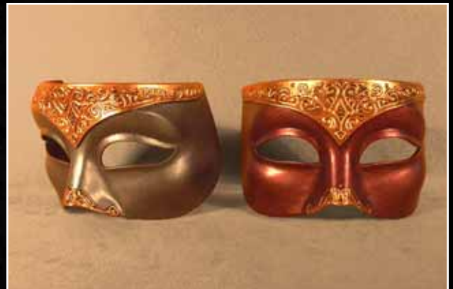
Loup Vénitien Moyen 58$ Eye Mask Venitian Medium