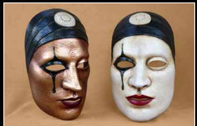
Pierrot la Lune Pierrot the Moon