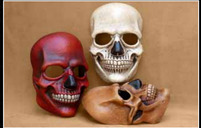
La Mort Death 95$