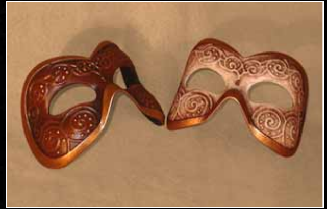
Loup Papillon Eye Mask Butterfly 58$