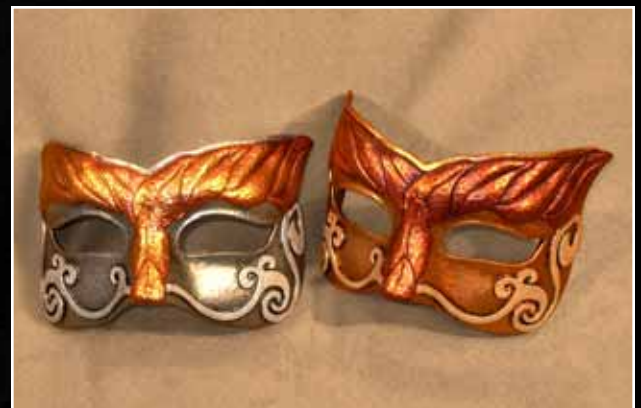
Loup Sylvestre Eye Mask Silvan 60$