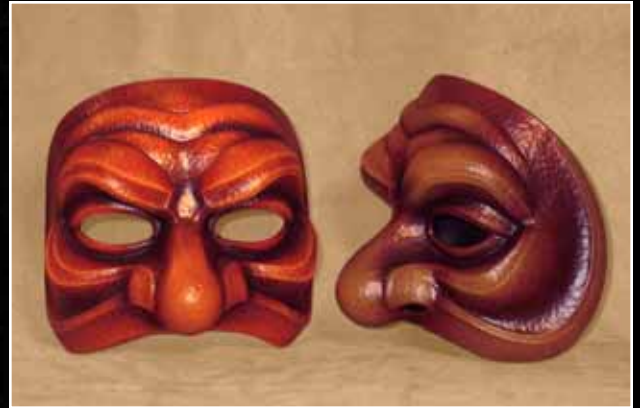
Brighella Moyen Brighella Medium 75$