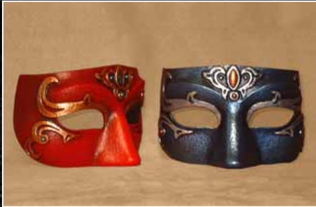
Loup Nobilis Eye Mask Nobilis 60$