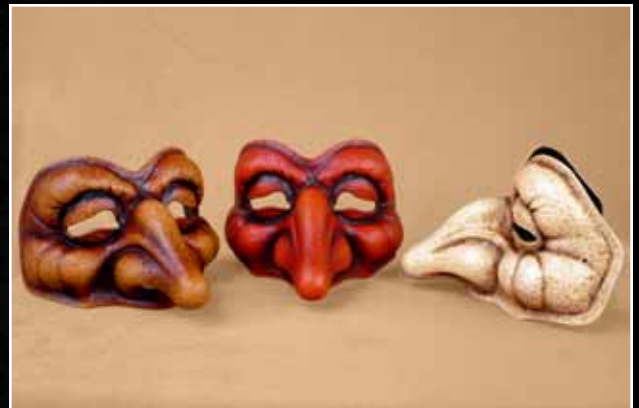
Pantalon Barbon 70$ Pantalon Old Fogey