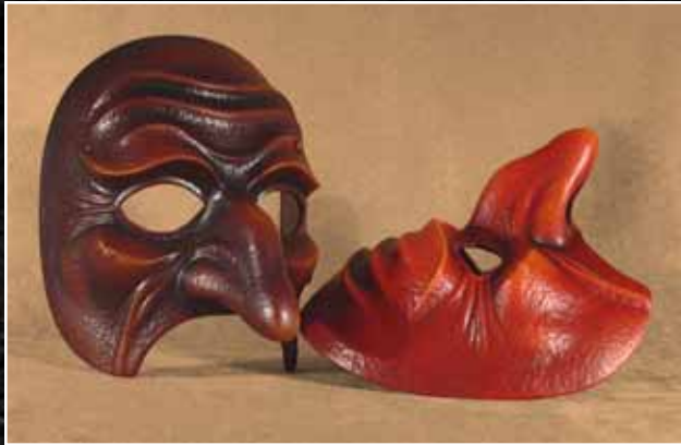
Pantalon Ancien 80$ Pantalon Ancien