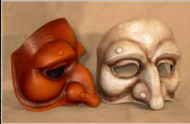
Polichinelle Lunaire 65$ Punchinello Moonlike