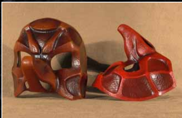
Capitaine Grand 75$ Captain Large