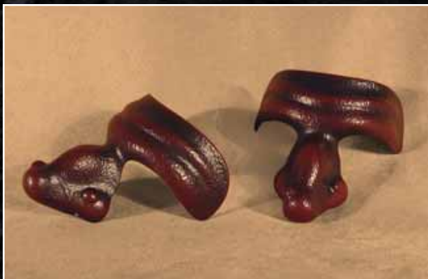
Docteur Balourd Doctor Clumsy 55$