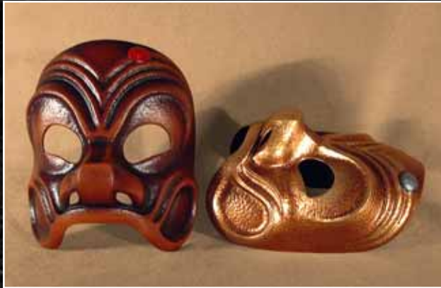
Arlequin Classique Grand 75$ Harlequin Classical Large