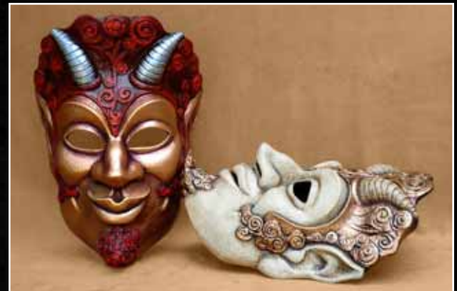
Faune Faun 105$