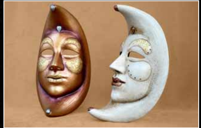
Lune Moon 115$