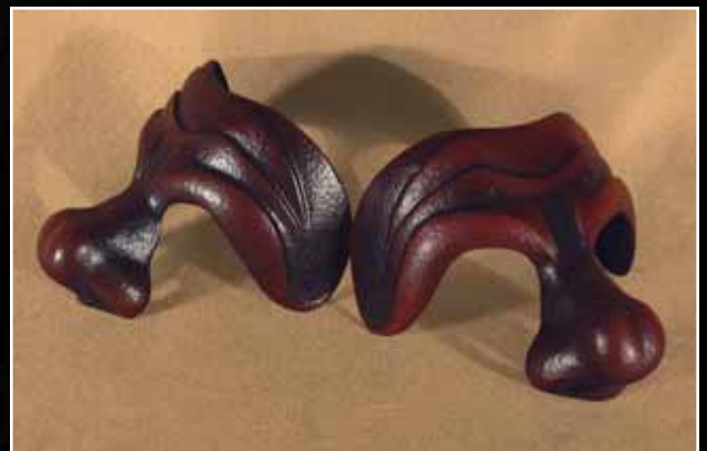
Docteur Classique Doctor Classical 55$