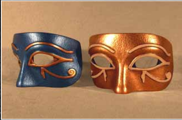
Égyptien Egyptian 60$