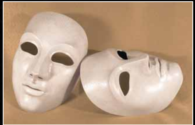
Neutre Moyen 70$ Neutral Medium