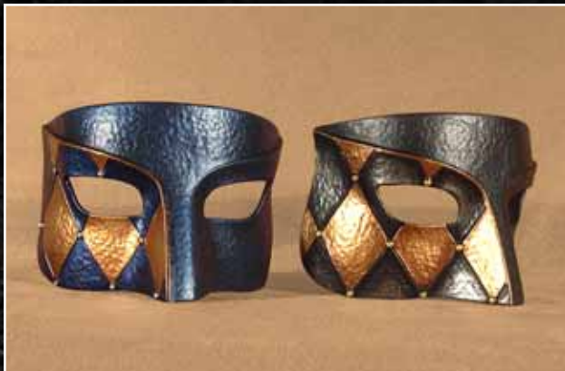
Loup Arlequin Grand 68$ Eye Mask Harlequin Large