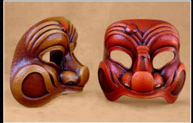
Arlequin Classique Moyen 75$ Harlequin Classical Medium