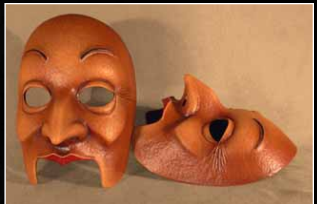
Vieillarde Old Lady 75$