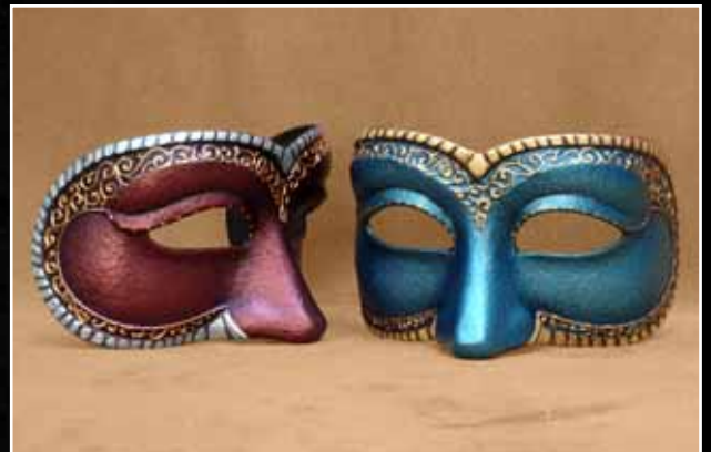
Loup Précieux Eye Mask Precious 60$