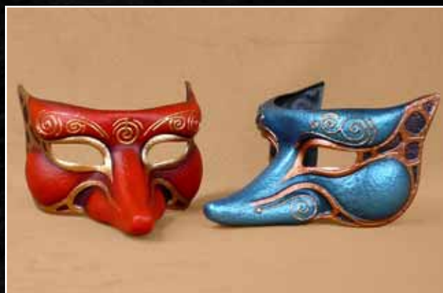
Grand farfadet Big Sprite 70$