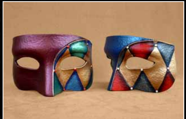
Loup Arlequin Moyen 68$ Eye Mask Harlequin Medium