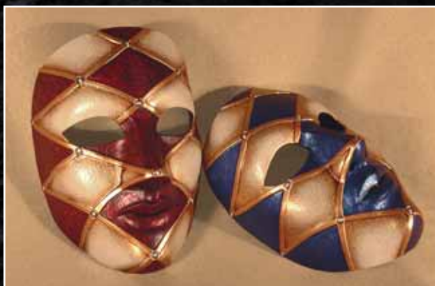
Neutre Arlequin Neutral Harlequin 85$