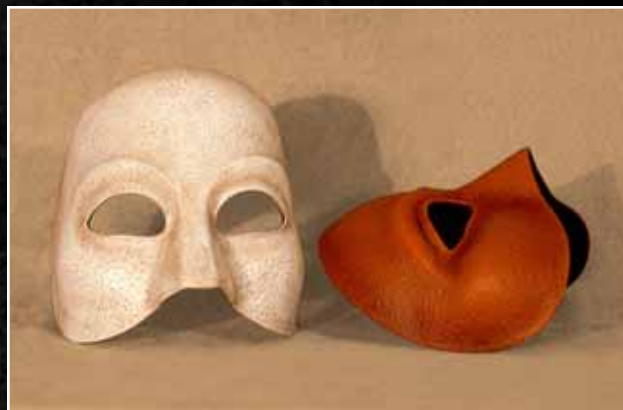
Demi-Neutre 60$ Half-Neutral