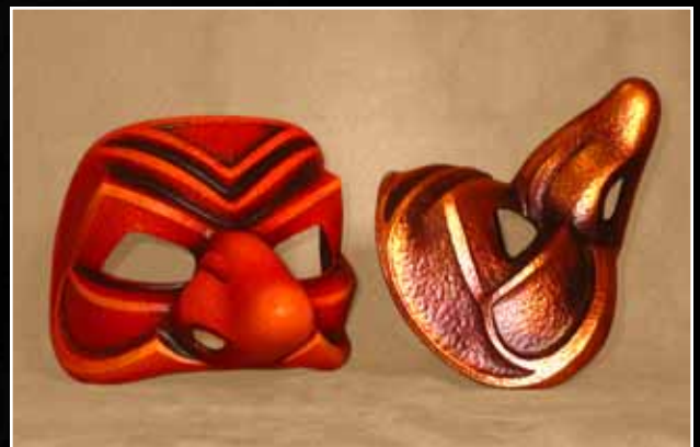
Capitaine Moyen 75$ Captain Medium