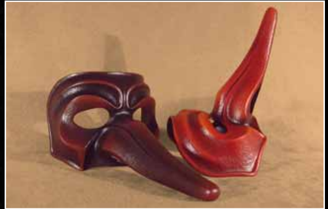
Pantalon Long 85$ Pantalon Long