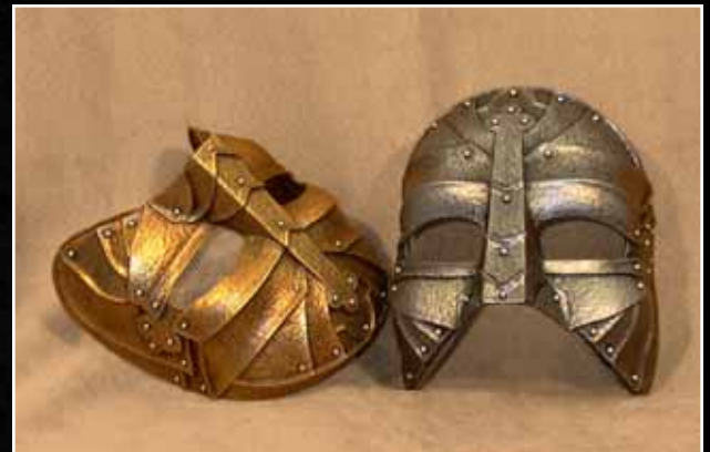
Chevalier Knight 70$