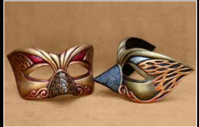
Loup Ailé Eye Mask Winged 60$