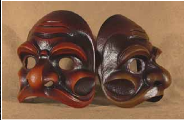
Brighella Grand Brighella Large 75$