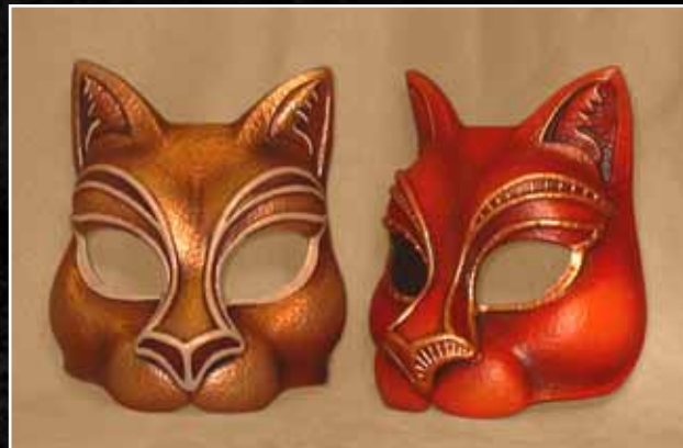
Chat Botté Puss in Boots