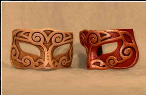
Loup Espiralle Moyen 57$ Eye Mask Espiralle Medium