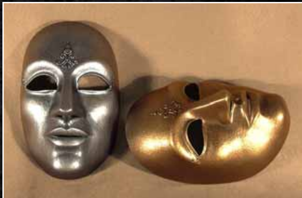
Neutre Décoré Grand Neutral Decorated Large 75$