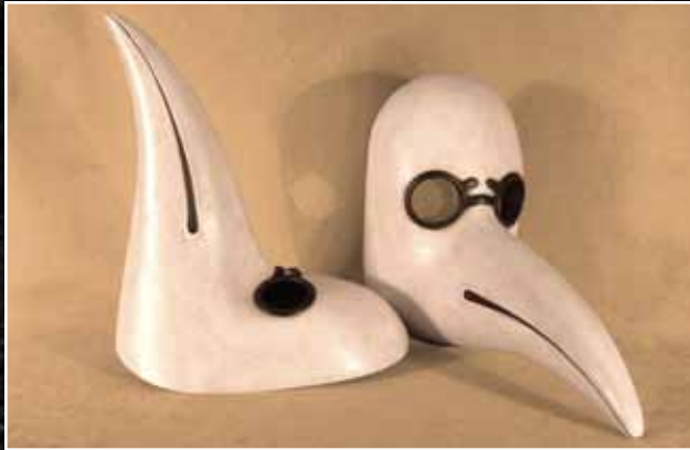
Médecin de la Peste 130$ Médico