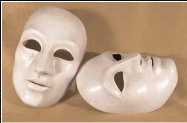
Neutre Grand 70$ Neutral Large