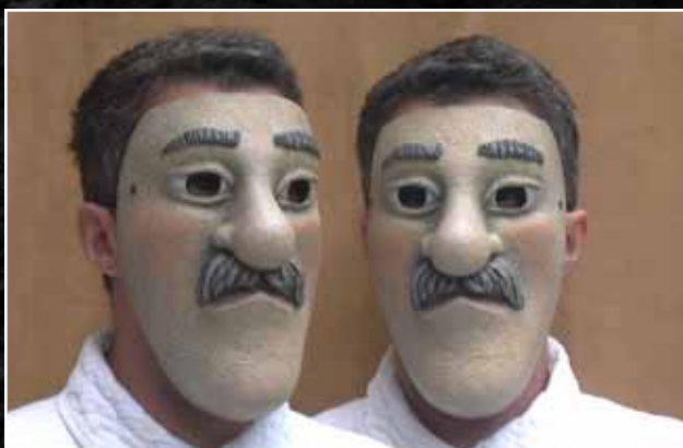
Monsieur 135$ Mister