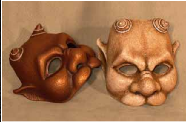
Gargouille Gargoyle 90$