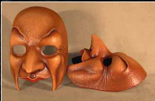
Vieillard Old Man 75$