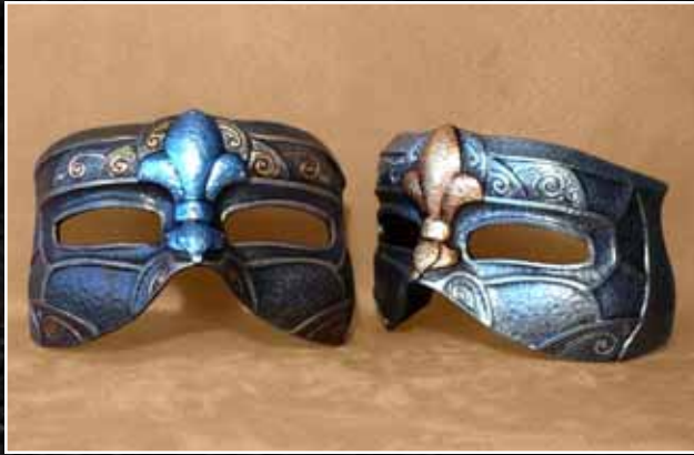
Loup Fleur de Lys 60$ Eye Mask Fleur de Lys