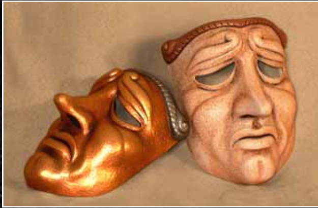
Jean qui pleure Tragedy 85$