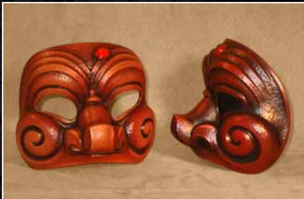
Arlequin Bouffon 75$ Harlequin Buffoon