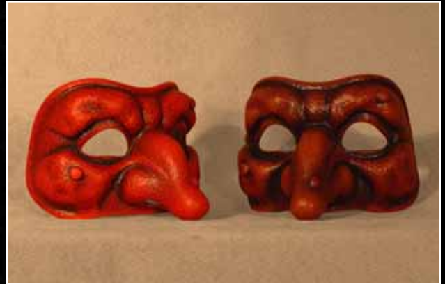
Polichinelle Classique 58$ Punchinello Classical