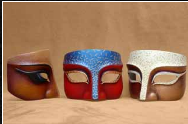
Grec Greek 65$