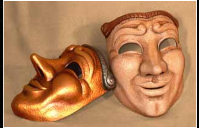
Jean qui rit Comedy 85$