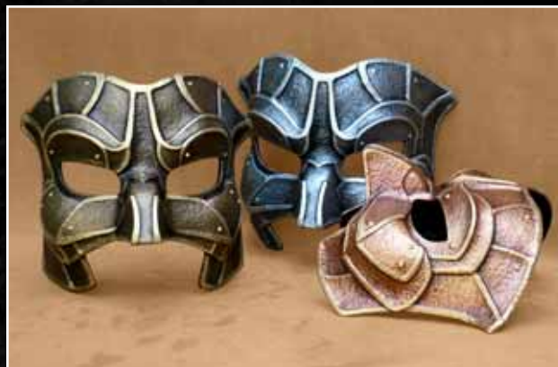
Guetteur Watchman 70$