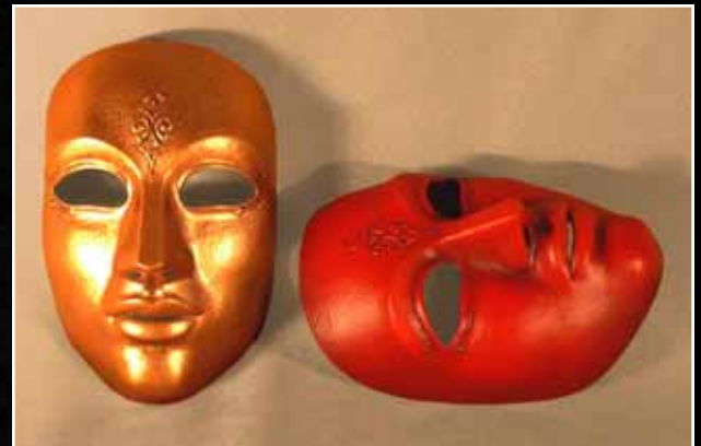
Neutre Décoré Moyen Neutral Decorated Medium 75$