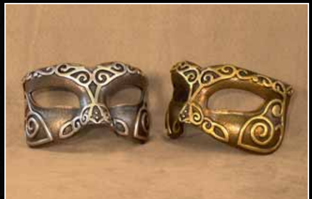
Loup Espiralle Moyen 57$ Eye Mask Espiralle Medium